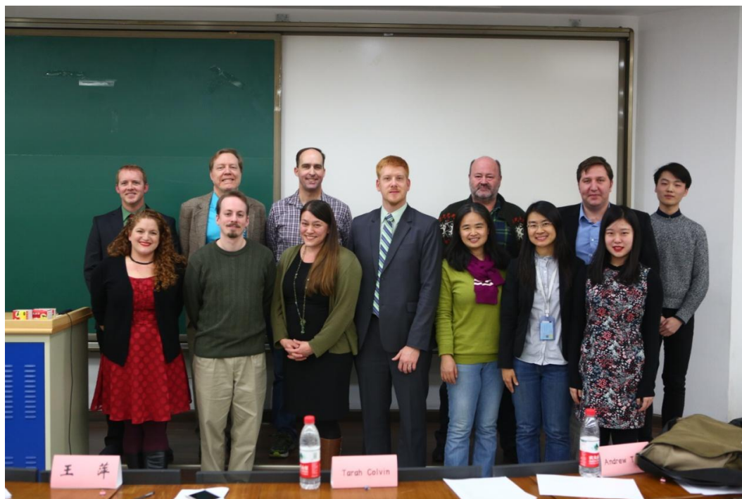
参赛评委和大赛组委会成员合影