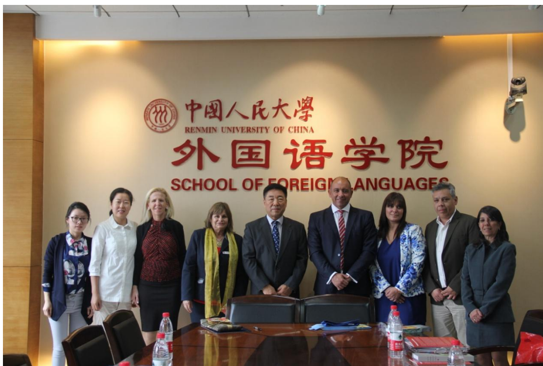
(图2 参会人员集体合影)