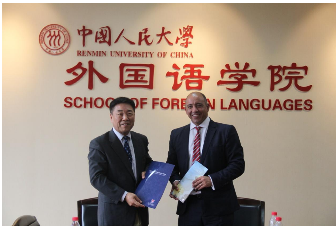
(图1 双方领导签署合作框架协议)