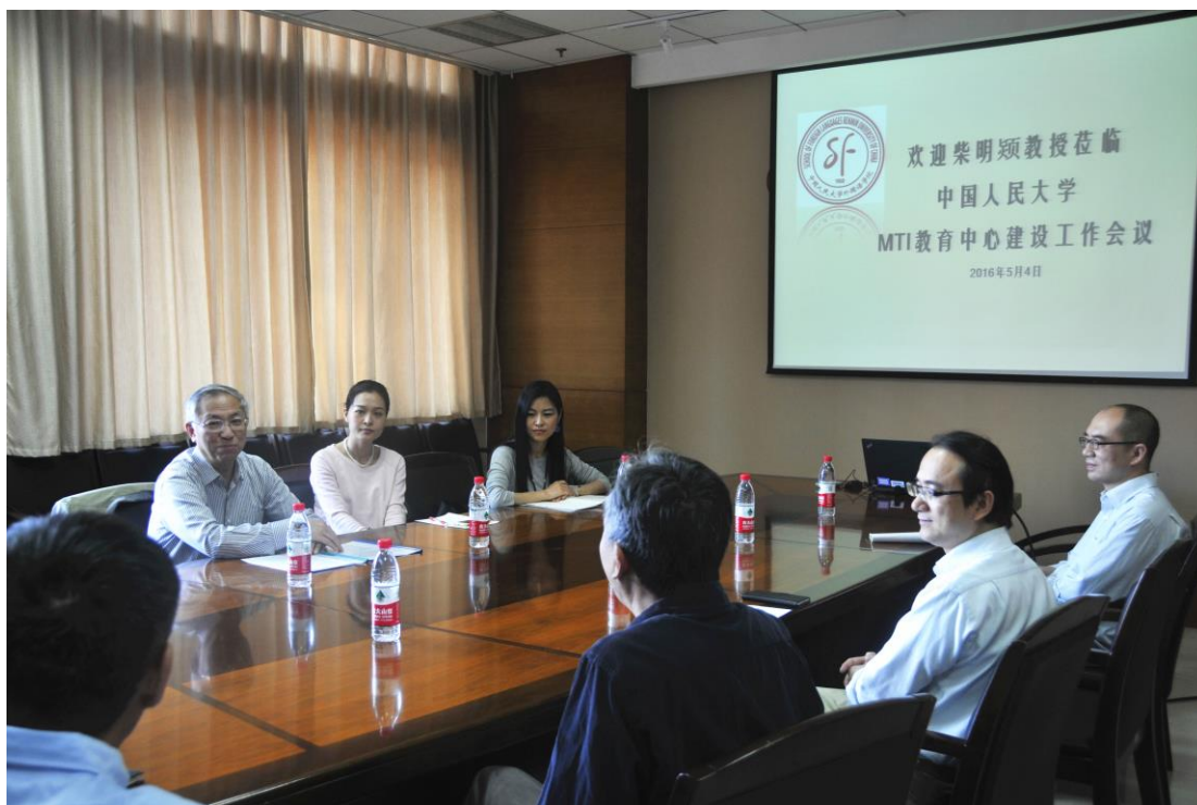
(图为柴教授参与我院MTI教育中心建设工作会议)

2016年5月4日，我院MTI教育中心举行2016年建设工作会议。上海外国语大学高级翻译学院创始人、国际高校翻译学院联合会副主席、高翻学院名誉院长柴明颀教授莅临会议，我院常务副院长王建平教授、副院长刁克利教授、MTI教育中心全体成员、教务科工作人员参与会议。